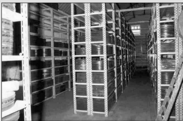
La Cineteca Lucana di Oppido Lucano