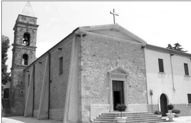
Il santuario di San Donato a Ripacandida e a destra l'altare della chiesa sovrastato dagli splendidi affreschi del '500

RIPACANDIDA - Ha deciso di puntare molto di più sullo sviluppo del turismo culturale e religioso, e ormai nessuno più può toglierlo dalla testa. Di quella degli amministratori comunali e soprattutto dei dirigenti e soci della Pro Loco. A Ripacandida si fa sul serio e le bellezze artistiche della Chiesa di S. Donato con i suoi stupendi e straordinari affreschi risalenti al '500, soprattutto dopo il gemellaggio di prestigio effettuato con la Basilica di San Francesco in Assisi, le si vogliono valorizzare fino in fondo. Com'è stato chiarito e stabilito pochi giorni fa nel corso di un convegno di studi sul tema: "Iconologia, tologia e antropologia negli affreschi di Ripacandida". Il relatore è stato il prof. Hans Belting, studioso tedesco di fama internazionale, a sua volta accompagnato dal prof. Thomas Hauschild, etnologo-antropologo dell'Università di Tubinga, già nel passato occupatosi del diffuso culto di San Donato nel piccolo